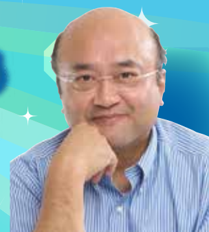
山形大学大学院 有機材料システム研究科 城戸 淳二 教授